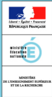
Schéma d'emplois 2011 - 2013